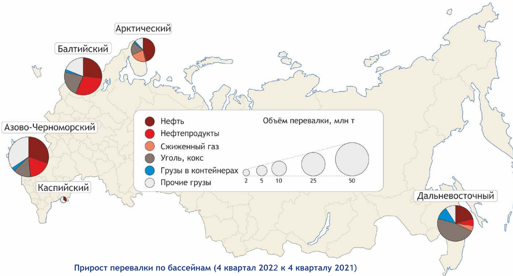
Прирост перевалки по бассейнам (4 квартал 2022 к 4 кварталу 2021)