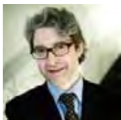
Роман Бауманис Nord Stream

Балтийский регион является ключевым торгово-транспортным коридором в торговле и транспортировке энергоносителей, как регионального значения – для СНГ и Европы, – так и в контексте мировых нефтегазовых рынков. В результате значительных усилий, направленных на развитие портовой инфраструктуры российского северо-запада Российская Федерация стала не только ведущим источником и экспортёром энергоносителей, но и ведущим оператором экспортных мощностей в регионе, лидером в восточной Балтике. Порты стран Балтии, традиционно ориентированные на обслуживание продуктовых потоков из России, Белоруссии, Казахстана, также играют свою важную роль в формировании этого торгово-транспортного узла. Балтийская нефтегазовая торгово-транспортная конференция, эволюционировавшая в этом году в Балтийскую Нефтегазовую Неделю, ориентирована на освещение и анализ деятельности этого региона как торгово-транспортного коридора и как конечного рынка.